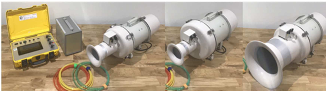
気密測定器 Dolphin 2 左からコントローラ (JIS/IBEC 対応版)、Dolphin-Air (C 値 0.1～1.5cm 2 /m 2 )、-Pro100 (0.1～2.0)、-Pro200 (0.3～6)

http://www.sunqeom.jp/DolphinRentalSaport20200501.pdf